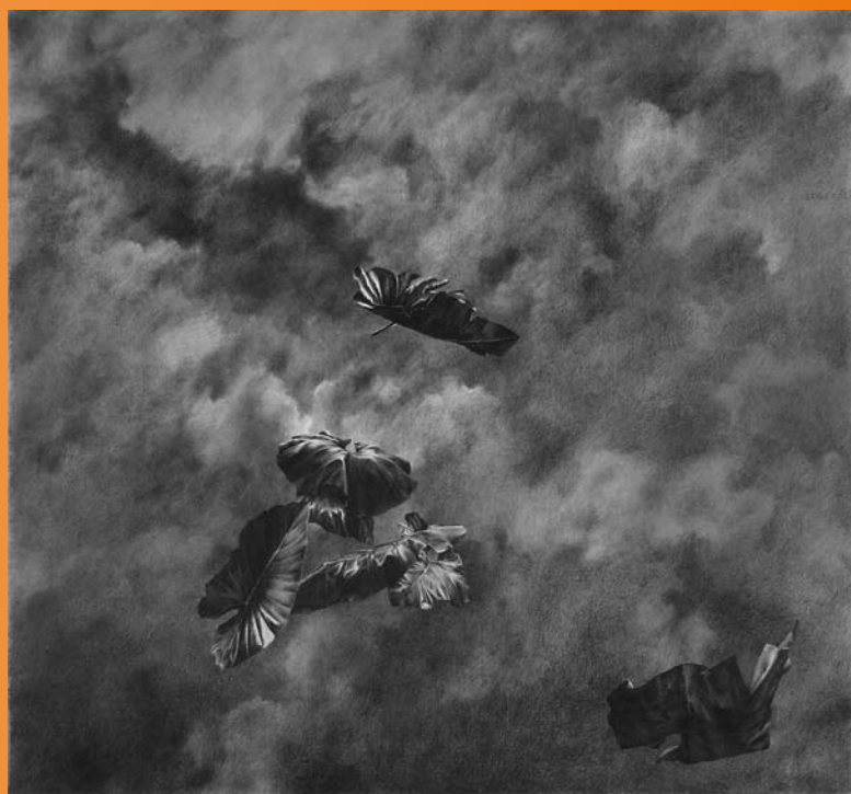
➡ ➡ ➡ Feuilles et ciel , 1982, mine de plomb, 140 x 150 cm