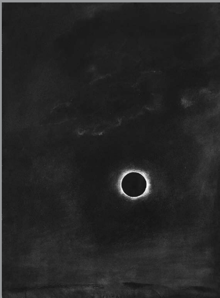
Eclipse , 2001, encre, 72 x 52 cm