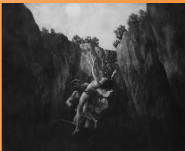
■ —————> Hadès enlevant Perséphone , 2005, mine de plomb et encre, 124 x 153 cm