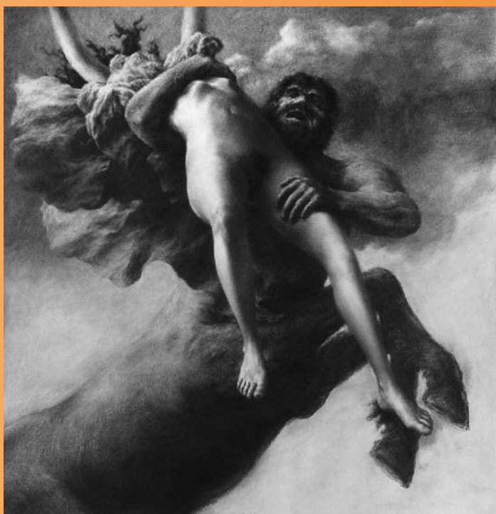
■ —————> Nessus et Déjanire : l'enlèvement , 2006, mine de plomb, 122 x 116 cm