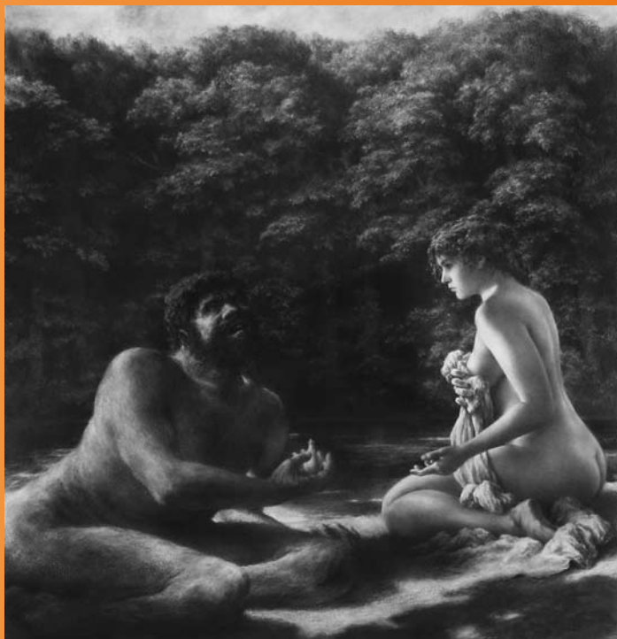
➡ ➡ Nessus et Déjanire : le don , 2006, mine de plomb, 122 x 116 cm