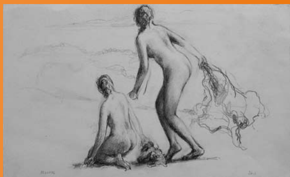
➡ ➡ ➡ Nymphes prenant la fuite , 2006, mine de plomb, 15 x 25 cm